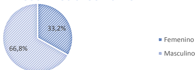
GRÁFICO N°1: DISTRIBUCIÓN DE USUARIOS SEGÚN SEXO